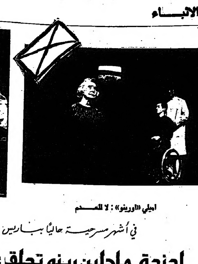
اجبتة (أورينو) : لا للمصمم